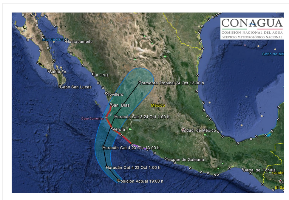
Trayectoria pronóstico del huracán PATRICIA (categoría 4).